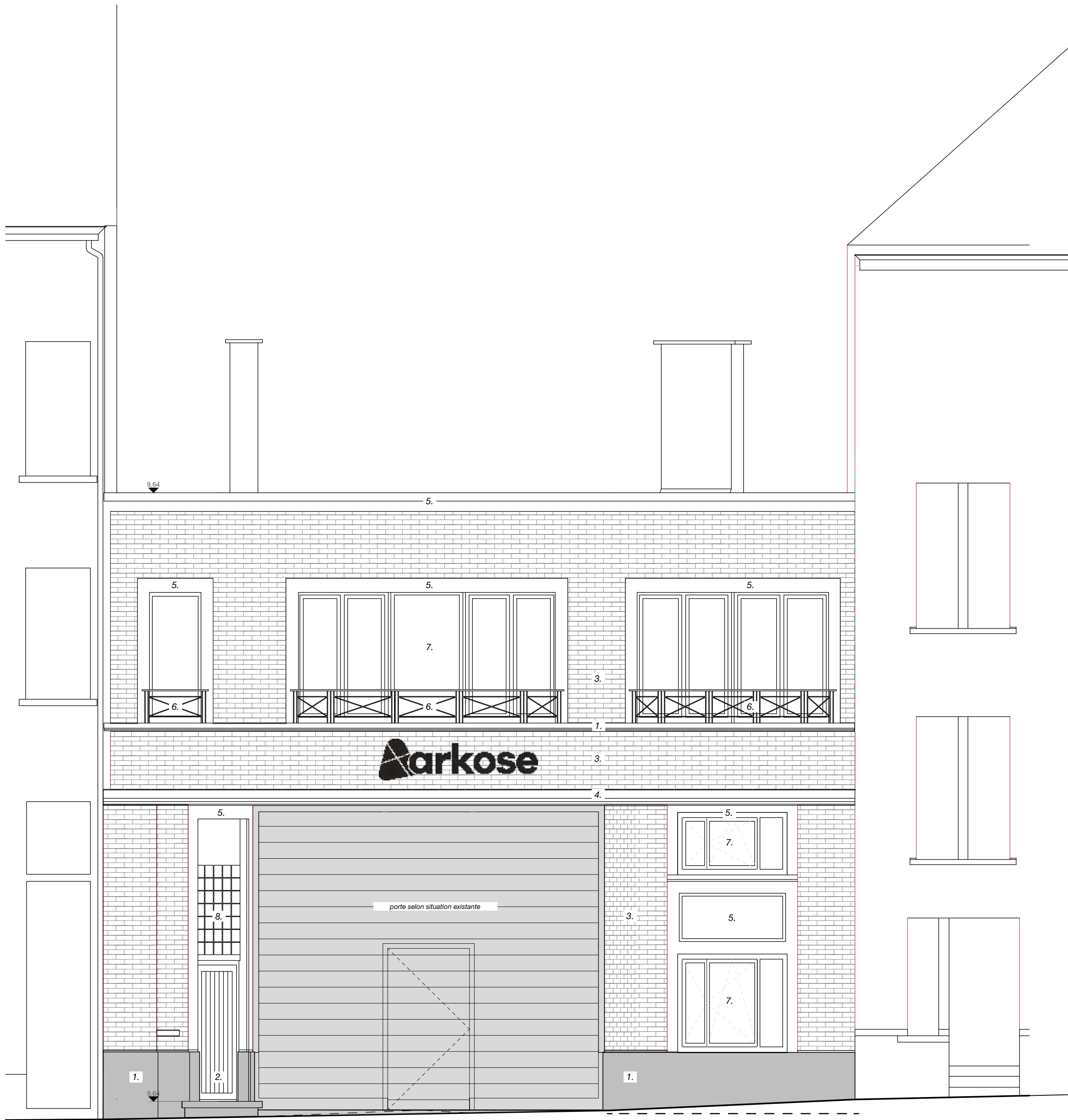
situation de fait _façade rue (1/50)